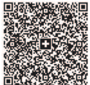
QR-Einzahlungsschein für eBanking